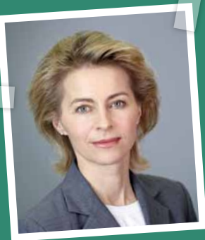
Ursula von der Leyen Bundesministerin für Arbeit und Soziales

„Mit der „aktion 12 – Abenteuer möglich machen“ geben die 95.000 Pfadfinderinnen und Pfadfinder der Deutschen Pfadfinderschaft Sankt Georg ein starkes Signal für eine Gemeinschaft, in der jeder seine Stärken entdecken kann – unabhängig davon, wie groß der eigene Geldbeutel ist.“